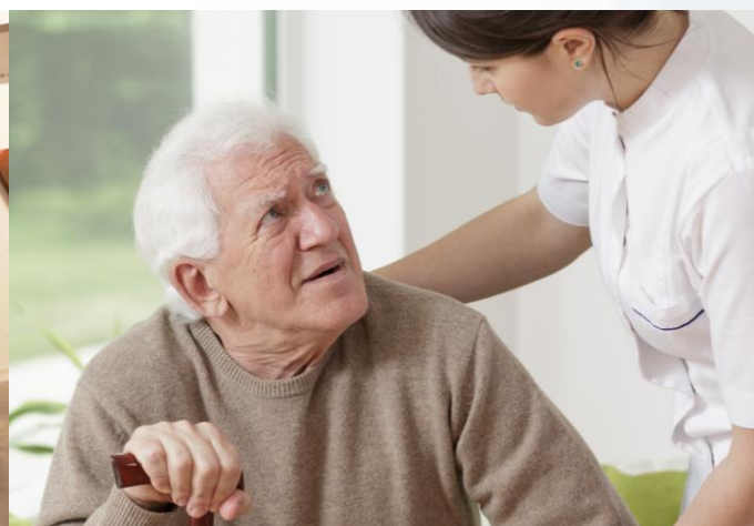
Promoção da Saúde