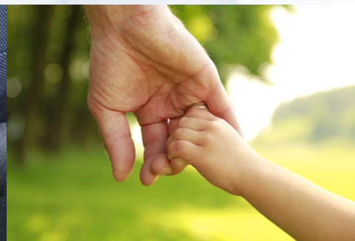
Seguro e Previdência Social