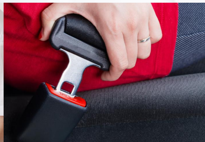
Prevenção e Segurança Viária