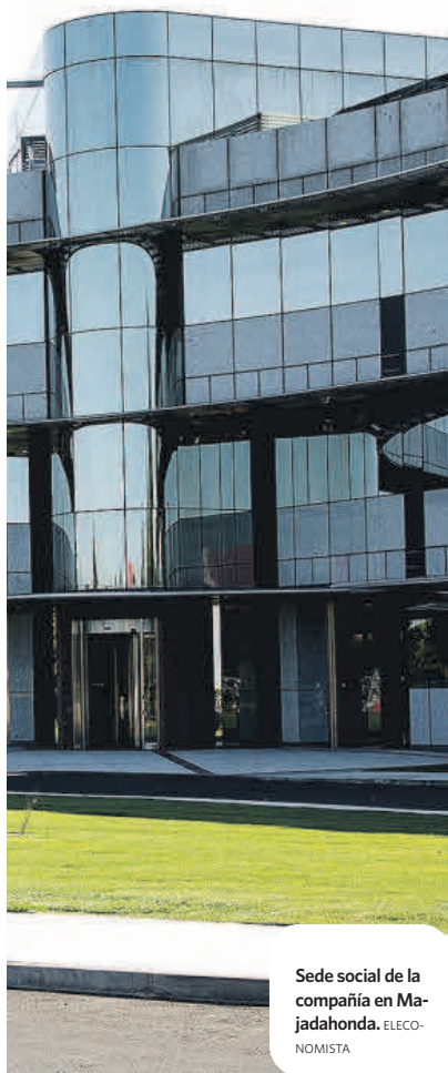
Sede social de la compañía en Majadahonda.

de gases en las instalaciones, estableciendo el compromiso de reducción de 14.710.519 kWh y 9.924 toneladas de CO2 equivalente (CO2e) respecto al año 2013, lo que supone un descenso del 20 por ciento de las emisiones de GEI.